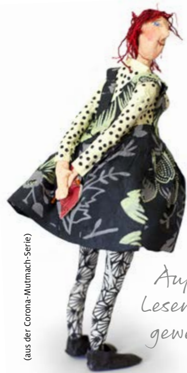
(aus der Corona-Mutmach-Serie)