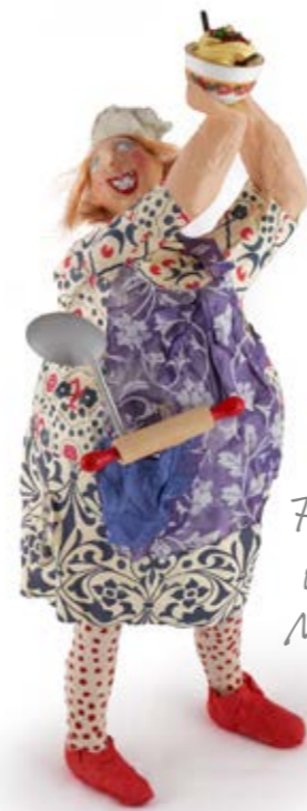
Futtern wie bei Mutttern