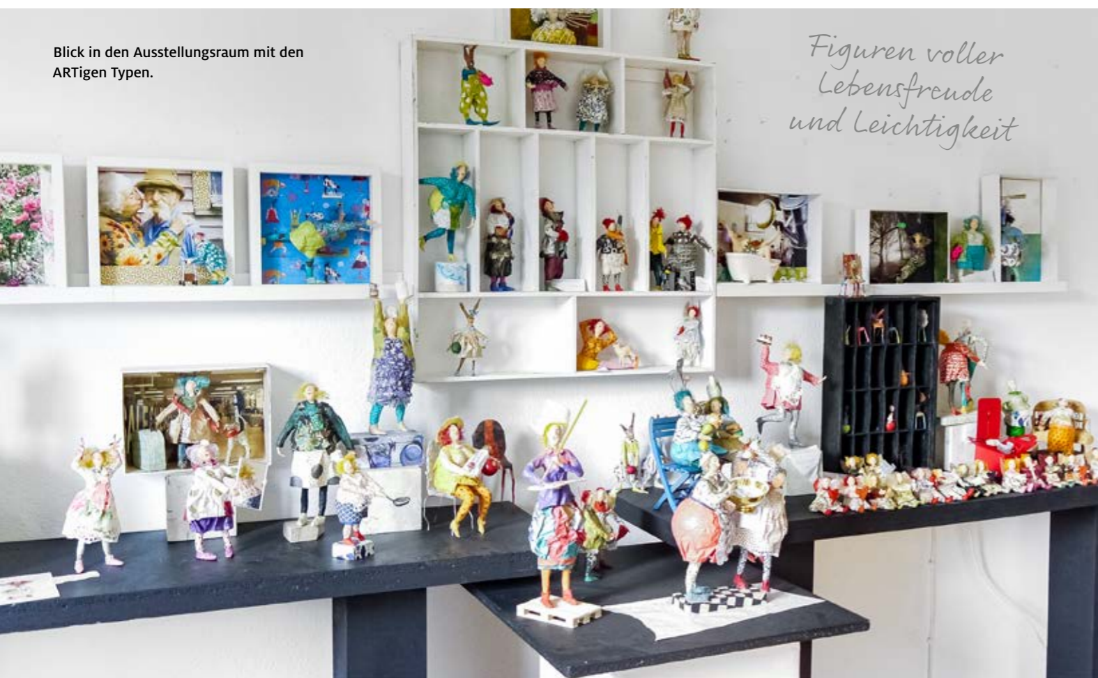
Blick in den Ausstellungsraum mit den ARTigen Typen.

Figuren voller Lebensfreude und Leichtigkeit