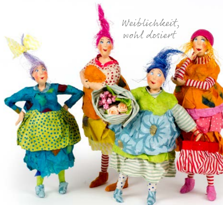
Text u. Redaktion: creativetoday/C. Rückel