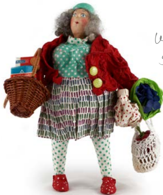
Vom Glück gestreift